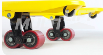
Ruedas de Poliuretano tipo tándem.