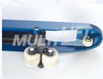
Rodillos de entrada y salida adicionales.