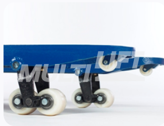
Ruedas de Nylamid tipo tándem.