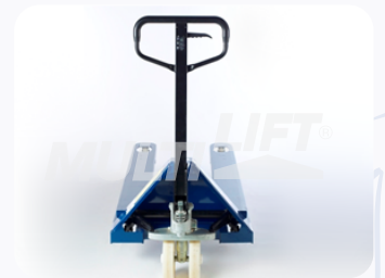
Maneral de operación con manija de 3 posiciones.