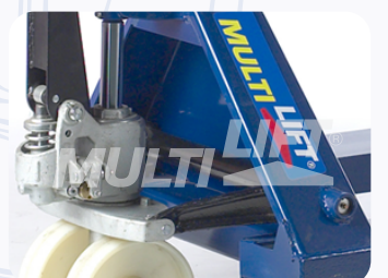
Bomba hidráulica de una sola pieza, que maximiza eficiencia y productividad.