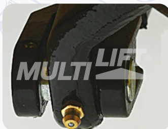
Graseras de lubricación en puntos clave.

Su mejor opción para manejar contenedores de medidas especiales con un largo de hasta 2.30 mts.